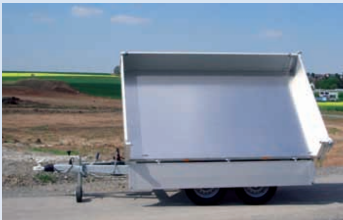
HKC 2526/170 Boden Alu, 4 Zurrbügel HKC 2526/170 Plancher en alu, 4 crochets d'arrimage HKC 2526/170 Aluminium platform, 4 tie rings