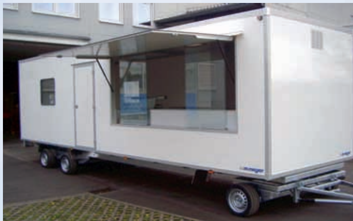
DSH 3580/244 Imbißwagen mit Gastraum DSH 3580/244 Remorque snack avec salle pour consommateurs DSH 3580/244 Snack trailer with room for customers