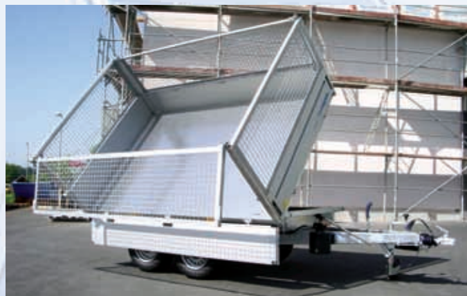
HKC 2526/170 Zubehör: Laubgitteraufsatz HKC 2526/170 Accessoire : rehausse grillagée HKC 2526/170 Optional extra: mesh extension sides

Kugelkupplung, Auflaufbremse, Chassis, Achse(n) und V-Deichsel verzinkt, Gummifederachse(n) mit Rückfahrautomatik, Chassis geschraubt , Stützrad, Aluboden, Alubordwände eloxiert (Stärke: 25 mm, Höhe: 330 mm), 4 Seiten klappbar, Heckwand auch schwenkbar, 4 Eckrungen, Leuchtenleiste, hydraulische Kippung mit Handpumpe