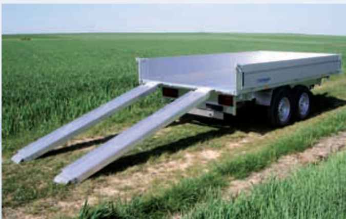
HKC 2526/170 Zubehör: Aluauffahrschienen HKC 2526/170 Accessoires : rampes en alu HKC 2526/170 Optional extras: aluminium ramps