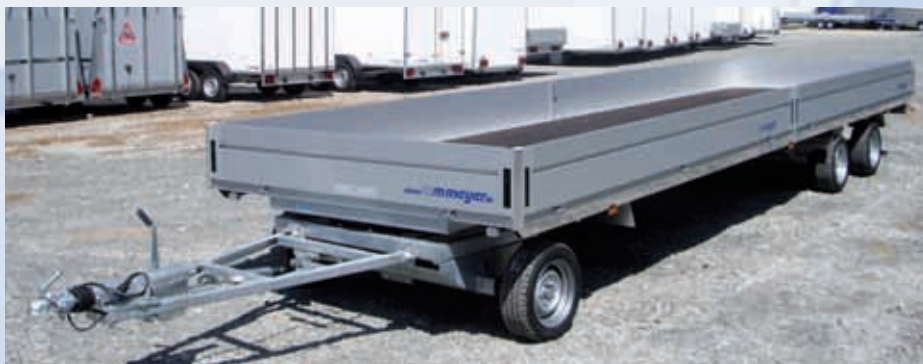
DSH 3580/244 Aluminiumbordwände mit Mittelrungen (ab 5 m Länge) DSH 3580/244 Ridelles en alu avec ranchers centraux (longueur : ≥ 5 m) DSH 3580/244 Aluminium side panels with centre posts (length: ≥ 5 m)