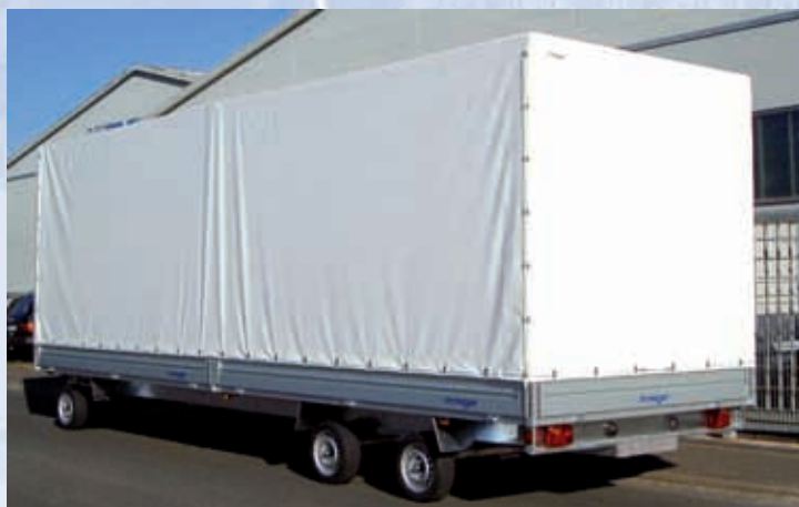
DSH 3580/244 Zubehör: Plane und Aluspriegel DSH 3580/244 Options : bâche et ossature en alu DSH 3580/244 Optional extras: canvas top and aluminium support