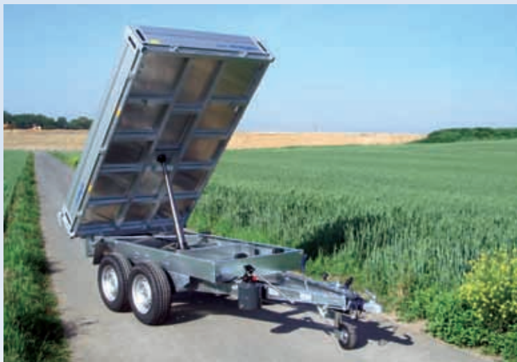
HKCR 2527/155 Aluboden, 14''-Bereifung HKCR 2527/155 Plancher en alu, pneus 14'' HKCR 2527/155 Aluminium treadplate platform, 14'' tyres