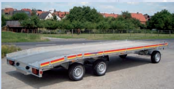
DSH 3580/244 Mit Aluriffelboden für Autotransport DSH 3580/244 Avec plancher en alu strié pour transporter des voitures DSH 3580/244 With aluminium platform for transporting cars