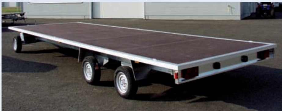
DSH 3580/244 Boden Siebdruckholz, keine Bordwände DSH 3580/244 Plancher en bois antidérapant imperméabilisé, sans ridelles DSH 3580/244 High-density plywood platform, without side panels