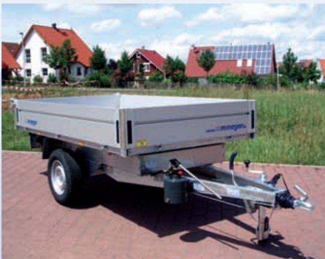
HKCR 1327/155 Stützrad verstärkt HKCR 1327/155 Roue jockey renforcée HKCR 1327/155 Reinforced jockey wheel

Kugelkupplung, Auflaufbremse, Chassis, Achse(n) und V-Deichsel verzinkt, Gummifederachse(n) mit Rückfahrautomatik, Chassis geschraubt , Stützrad, Aluboden, Alubordwände eloxiert (Stärke: 25 mm, Höhe: 330 mm), 4 Seiten klappbar, Heckwand auch schwenkbar, 4 Eckrungen, Leuchtenleiste, hydraulische Kippung mit Handpumpe