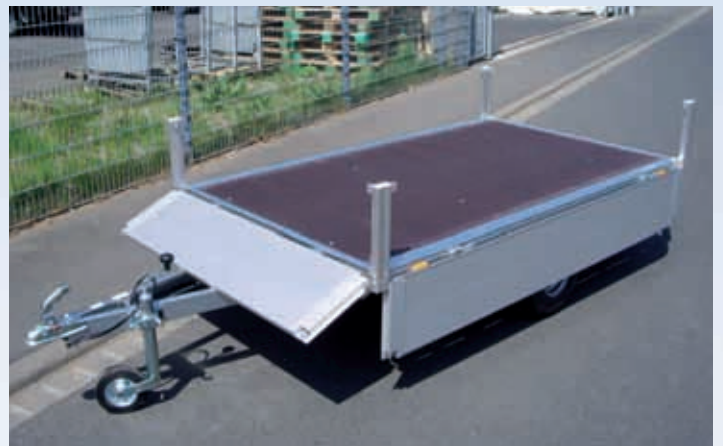
HLN 7525/151 Alle Bordwände klappbar, Eckrungen Alu HLN 7525/151 Toutes les ridelles ouvrables, ranchers en alu HLN 7525/151 All side panels can be opened, aluminium corner posts