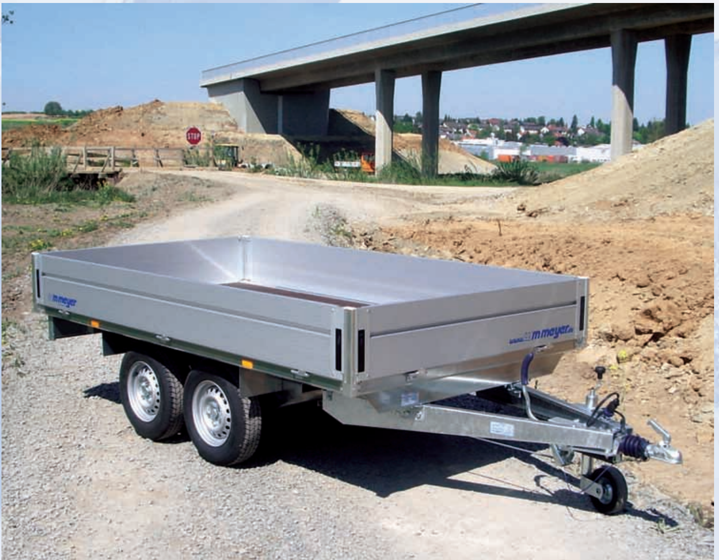
HLN 2031/170 Achsen, Rahmen und V-Deichsel verzinkt, Stützrad verstärkt, Siebdruckboden, Alubordwände eloxiert (Stärke: 25 mm, Höhe: 330 mm), Verschlüsse innenliegend HLN 2031/170 Essieux, châssis et timon en V galvanisés, roue jockey renforcée, plancher en bois antidérapant imperméabilisé, ridelles en alu anodisé (épaisseur : 25 mm, hauteur : 330 mm), serrures intégrées aux ridelles HLN 2031/170 Galvanised axles, chassis and V drawbar, reinforced jockey wheel, high-density plywood platform, anodised aluminium side panels (width: 25 mm, height: 330 mm), fastenings integrated into side panels