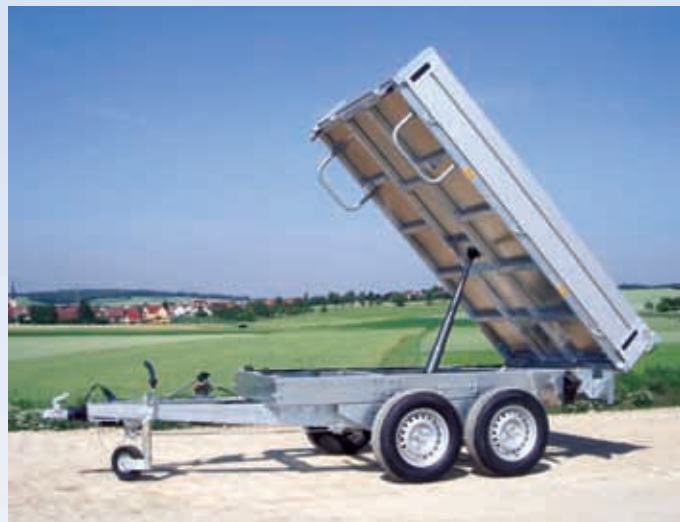
HKCR 3027/155 Zubehör: Unterfahrtschutz (links und rechts, für den französischen Markt: Serie) HKCR 3027/155 Option : pare-cyclistes (à gauche et à droite, pour le marché français : équipement standard) HKCR 3027/155 Optional extra: pare-cyclistes (left and right, for the French market : standard feature)