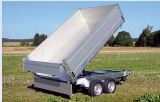
HKC 2531/186 Massive geschweißte Brücke, Zubehör: Bordwanderhöhung HKC 2531/186 Plateau soudé massif, option: deuxième jeu de ridelles HKC 2531/186 Solid welded platform, optional extra: second set of side panels