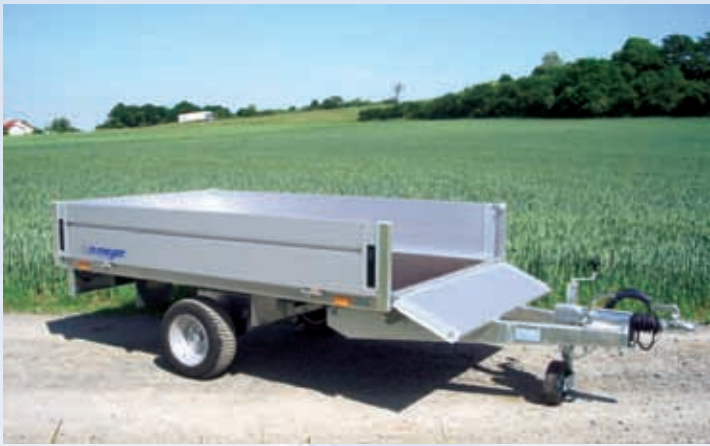
HLN 1523/141 Achse, Rahmen und V-Deichsel verzinkt, Stützrad, Alubordwände eloxiert, Verschlüsse innenliegend HLN 1523/141 Essieu, châssis et timon en V galvanisé, roue jockey, ridelles en alu anodisé, serrures intégrées aux ridelles HLN 1523/141 Galvanised axle, chassis and V drawbar, jockey wheel, anodised aluminium side panels, fastenings integrated into side panels