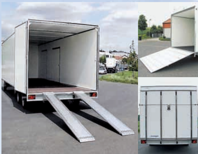
DSH 3570/210 Zubehör: Aluminiumauffahr- Heckrampe schienen, 2 Seitentüren DSH 3570/210 Options : rampes en alu, 2 portes latérales DSH 3570/210 Optional extras: aluminium loading ramps, 2 side doors